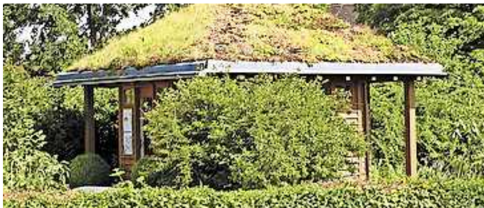
www.ogv.at