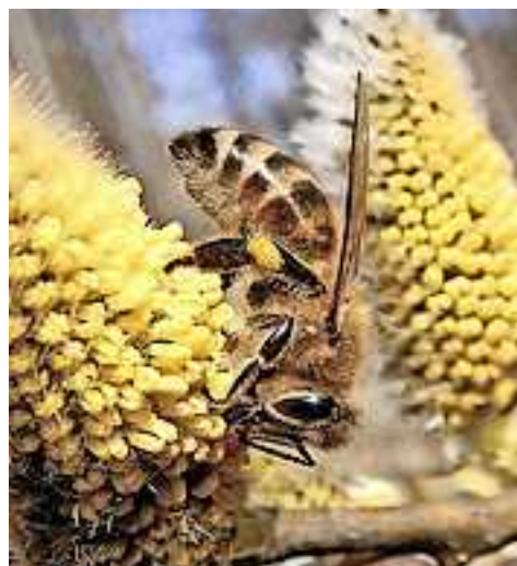
Frühlings-Seidenbiene im Glitz

Mit milden Temperaturen und vielen Sonnenstunden hat der Frühling vergangenes Wochenende bereits ein deutliches Lebenszeichen zu erkennen gegeben - und zarte Pflänzchen wie Himmelsschlüssel und Buschwindröschen sprießen lassen. Übrigens: Die Frühlings-Seidenbiene hat heuer schon eine Wahl gewonnen, sie wurde nämlich zur Wildbiene des Jahres 2023 gewählt.