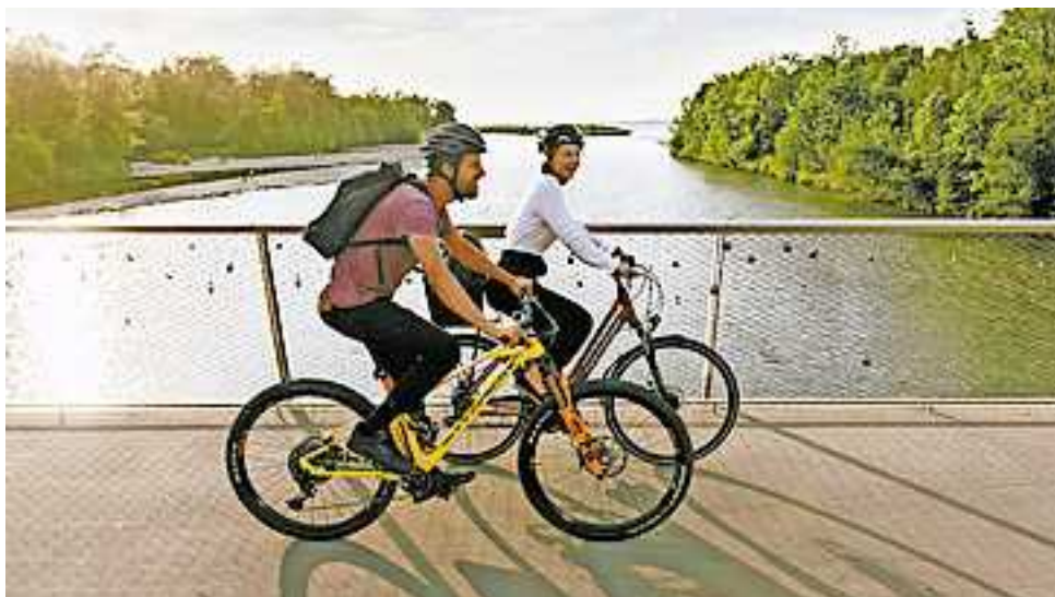
Radius 2023: Mitradeln und tolle Preise gewinnen.