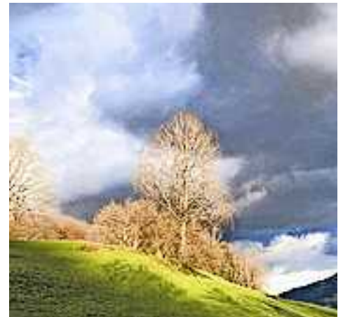
Text und Bild: Erna Gächter

Öffnungszeiten Pfarrbüro: Das Pfarrbüro bleibt bis 7. April geschlossen! Dienstag 9.00 bis 11.00 Uhr Donnerstag 17.00 bis 19.00 Uhr