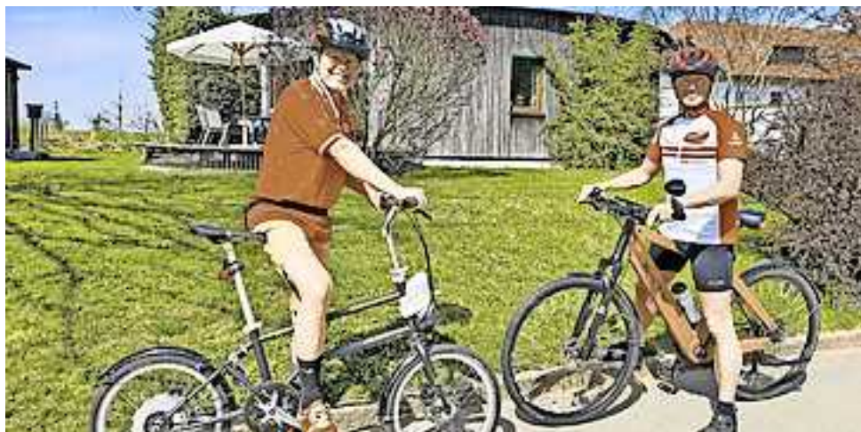
Auf www.passathon.at sind alle weiteren Informationen zu finden.