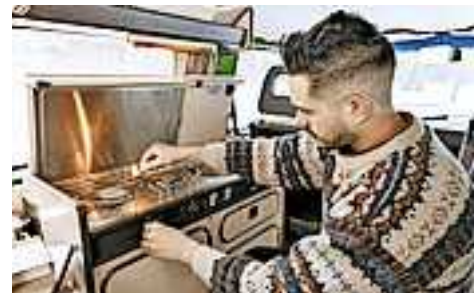
Weitere Informationen zum Thema Kohlenmonoxid auf www.sicheresvorarlberg.at

Raum statt und sie haben einen Rauchabzug. Dieser Rauchabzug muss regelmäßig geprüft werden. Du findest ihn normalerweise im Schrank über dem Herd. Prüfe, ob der Rauchabzug senkrecht hängt und keine Knicke aufweist. Prüfe auch, ob das Ende des Abzugs frei und sauber ist.