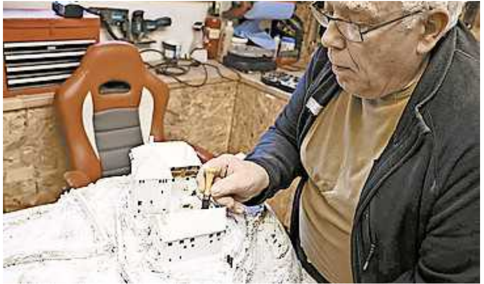
Das Modell nach Ansichten aus dem 16. Jahrhundert in der Entstehungsphase in der Werkstatt von Franz Wäger