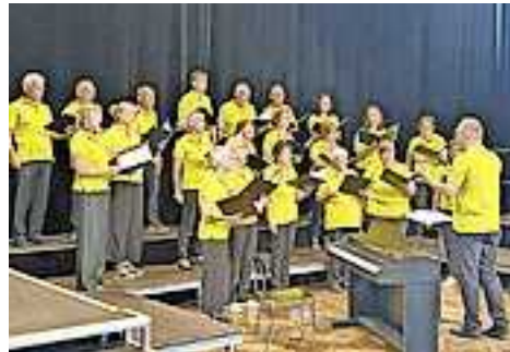
Kirchenchor St. Killian