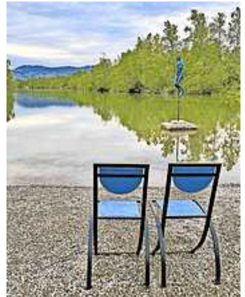
Im Areal des Kieswerks „Kopf-Kies“ am Alten Rhein (Rheinstraße 71, Altach), wird das Freilufttheater aufgeführt.

Der Kartenvorverkauf startet am 18. Juli 2023. Die Aufführung findet an fünf Terminen sowie zwei wetterbedingten Ersatzterminen statt. Karten können online und direkt beim Stadtmarketing Hohenems gekauft werden.