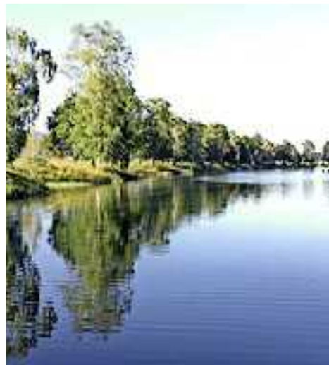
Text & Bild: Erna Gächter