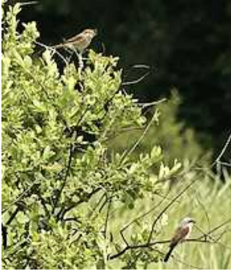
Neuntöter-Paar im Höller