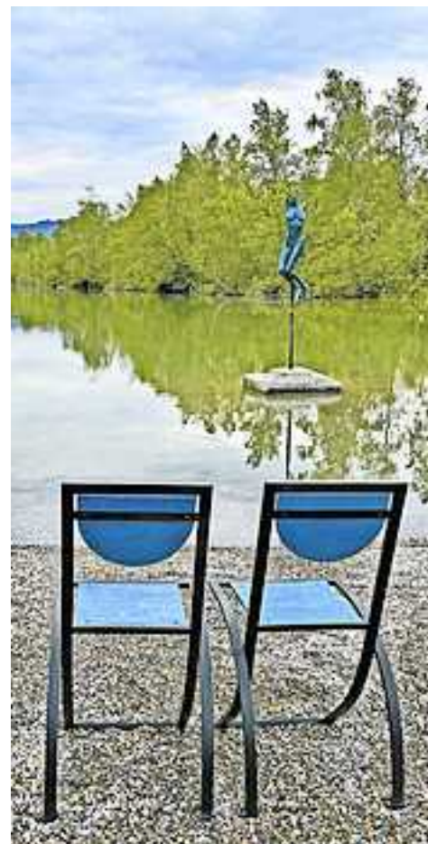
Auf dem Areal des Kieswerks „Kopf-Kies“ am Alten Rhein (Rheinstraße 71, Altach) wird das Freilufttheater aufgeführt.