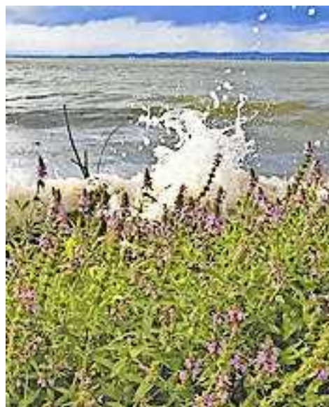
Text und Bild: Erna Gächter

Homepage: Sie finden uns unter www.pfarre-koblach.at