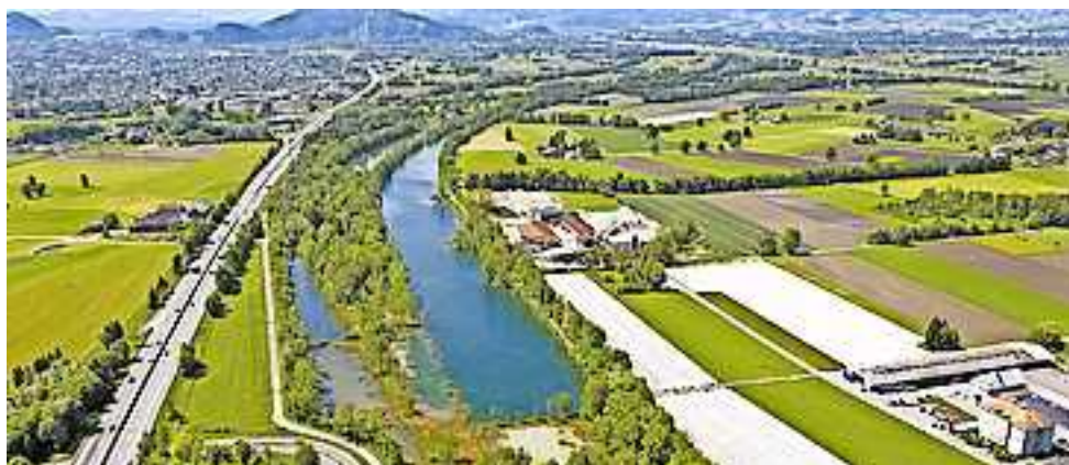
Der Rheindurchstich hat die Natur und Entwicklung Vorarlbergs maßgeblich geprägt.

und verändert hat. Die Dokumentation blickt auch in die Zukunft. Der Alpenrhein soll im Hinblick auf den Klimawandel noch sicherer und aus seinem starren Flussbett befreit werden.