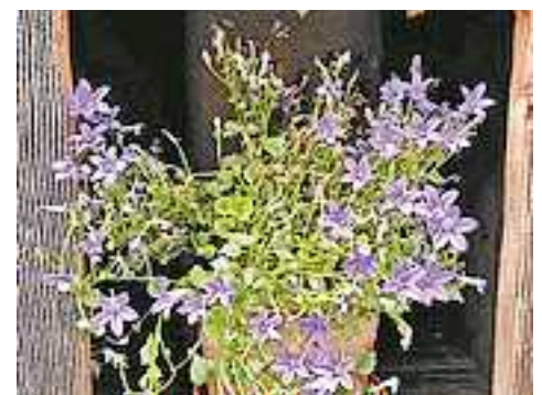
Text & Bild: Erna Gächter

Sie finden uns unter www.pfarre-koblach.at