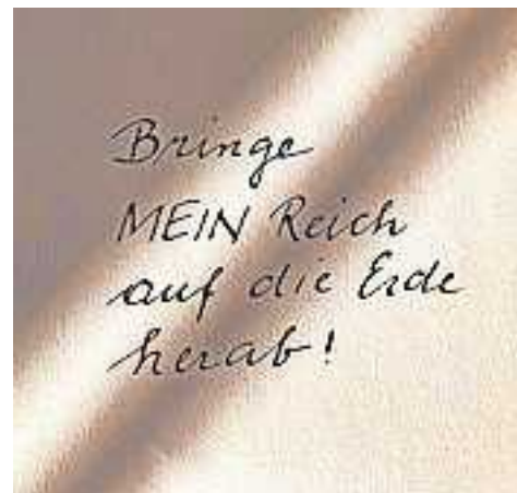
Text: Erna Gächter

Homepage: Sie finden uns unter www.pfarre-koblach.at