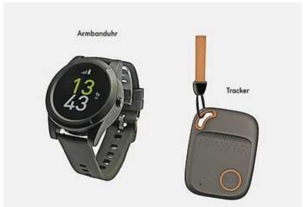
Das mobile Rufhilfe-System

Da der Sender immer dabei ist, kann die Alarmierungskette mit einem einfachen Knopfdruck gestartet werden. Die erste Verbindung wird immer zur Rettungs- und Feuerwehrleitstelle hergestellt. Im Anschluss werden je nach Bedarf Ersthelfer oder Vertrauens-