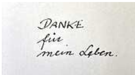
Text und Bild: Erna Gächter