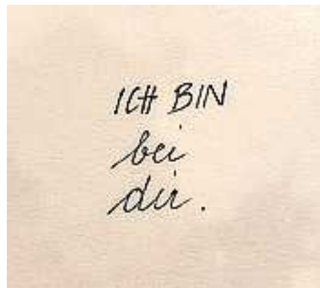
Text und Bild: Erna Gächter

Homepage: Sie finden uns unter www.pfarre-koblach.at