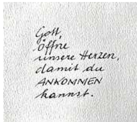
Text: Erna Gächter

Homepage: Sie finden uns unter www.pfarre-koblach.at