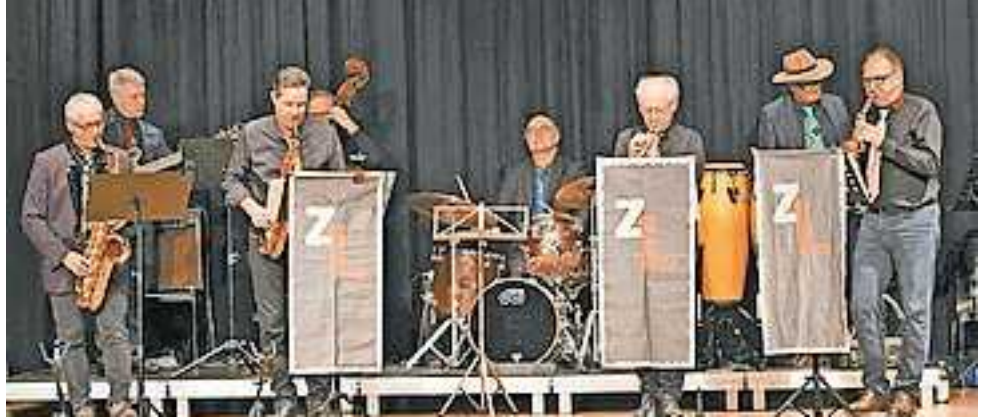
Heizten dem Koblacher Neujahrs-Publikum ordentlich ein: Die Zitternden Lippen.