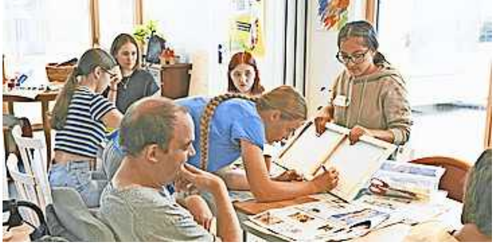
Gemeinsam Gutes tun

Mit einem Get-together im gemütlichen Ambiente der CampusVäre in Dornbirn sind die MACHWAS-Tage 2024 gestartet. Organisationen und Vereine, die bei den MACHWAS-Tagen vom 26. Juni bis 3. Juli 2024 dabei sein möchten, können ihre Projektideen ab sofort und noch bis 22. März 2024 einreichen. Weitere Infos finden Sie unter www.aha.or.at/machwas-tage