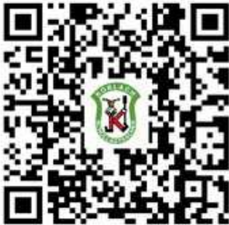
Zur Bildergalerie auf www.koblach.at