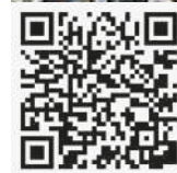
Zur großen Bildergalerie auf www.koblach.at