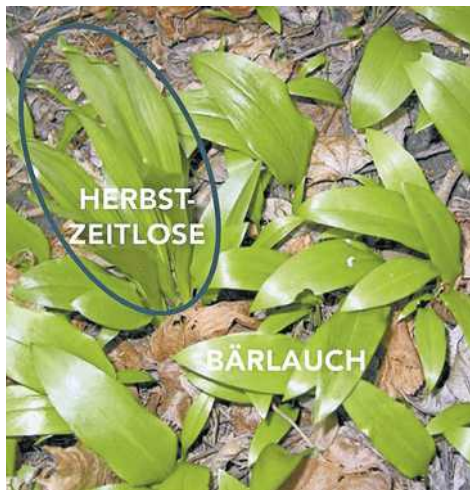
Augen auf beim Pflücken!