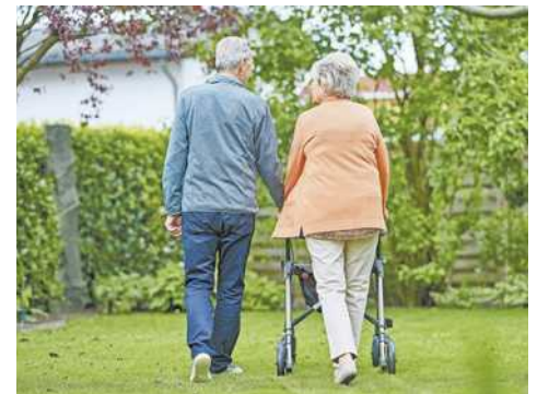
Lebenswert älter werden.

Für weitere Tipps für ein selbstbestimmtes Älterwerden steht die Broschüre LEBENSWERT ÄLTER WERDEN zum Download auf sicheresvorarlberg.at oder zur Bestellung über info@sicheresvorarlberg.at bereit. Zudem organisiert Sicheres Vorarlberg auf Anfrage Vorträge zur Sturzprävention. Infos online oder bei Sandra König: sandra.koenig@sicheresvorarlberg.at , Tel. 05576 94141-12.