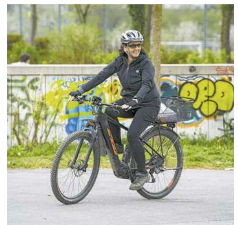
Das Frühlingswetter lockt derzeit, sich auf zwei Rädern fortzubewegen

Mit all diesen Tipps steht einer gelungenen und sicheren Radsaison nichts mehr im Wege. Sicheres Vorarlberg bietet außerdem verschiedene E-Bike-Kurse an, um die Fahrtechnik zu verbessern. Mehr Informationen: sicheresvorarlberg.at .