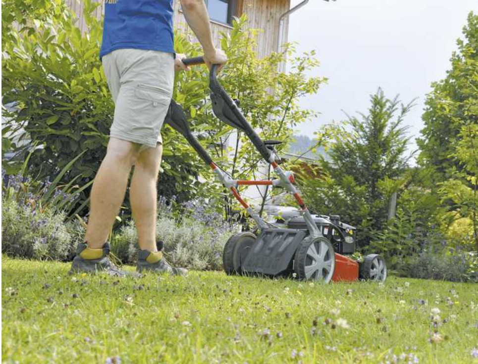
Auch Rasenmähen birgt Gefahren