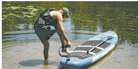
Auch Paddeln birgt einige Gefahren

Schätze dein Können realistisch ein und wähle ein stabiles Board, besonders als Anfänger.