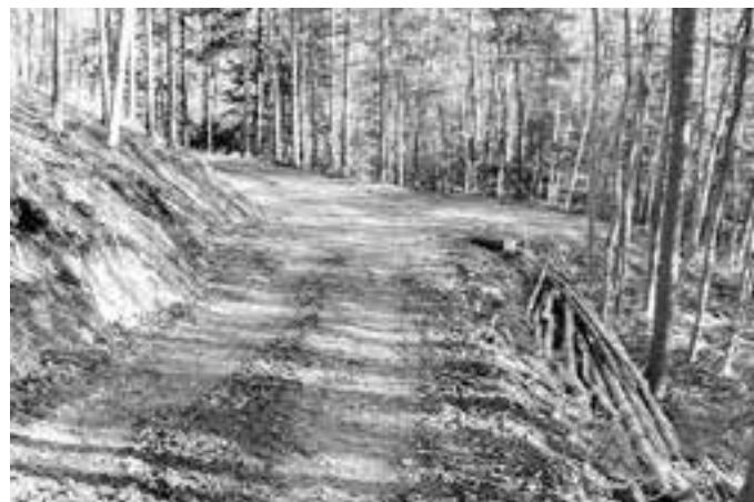
„Eichwäldle“ soll forstwirtschaftlich erschlossen werden.

Derzeit ist dieses Waldgebiet nur durch einen Forstweg am Hangfuß erreichbar und forstwirtschaftlich nicht erschlossen. Durch die Realisierung des Wegeprojektes „Eichwäldle“ soll die Grundlage für eine Kleinfläche, naturnahe Waldbewirtschaftung und -pflege geschaffen werden. Ein Waldgebiet von rund 5 ha wird durch dieses Forstwegeprojekt