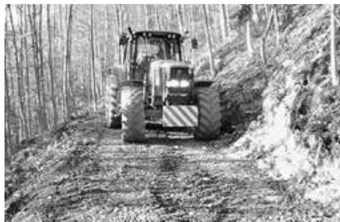
Die Baumaßnahmen beim „Eichwäldle“ sind fast abgeschlossen.

Ausgehend vom bestehenden Forstweg bei der „Krinna-Stiege“ zweigt die neue Trasse mit einer Kehre in Richtung Süden ab und führt mit 7–8 % Steigung durch mäßig steiles Gelände. Bei ca. hm 2,6 im Bereich einer Felsstufe schwenkt die Trasse in Richtung Westen, wo eine Hangverflachung erreicht wird. Eine weitere Felsstufe wird mit einer Steigung von max. 17% überwunden. Die Gesamtlänge des Forstweges beträgt rund 390 m.