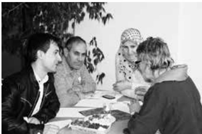
Interessante Begegnungen im Sprachen-Cafe

Im Zentrum des Sprachen-Cafés steht die Begegnung mit Menschen, deren Muttersprache nicht Deutsch ist. Unter dem Motto: „Mit reda kond d`Lüt zemma“ finden Menschen, Kulturen und Sprachen in gemütlicher Atmosphäre zueinander. Das Sprachen-Café findet wöchentlich am Mittwoch, von 18.00 – 20.00 Uhr im Haus Koblach, Wegeler 10, statt. Das Team vom Sprachen-Café in Zusammenarbeit mit „z`Kobla dahoam“ freut sich auf DICH.