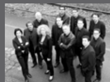
SPINNING WHEELS RHYTHM N BLUES - SOUL CAFÉ HOTEL SCHATZ - EINTRITT FREI