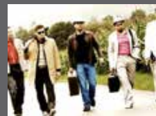
THE SPOONERS ROCKCOVERS 40 70 80 VISIONSCAFÉ - EINTRITT FREI

ALLE INFOS UND ETWAIGE KURZFRISTIGE ÄNDERUNGEN AUF: WWW.LIVE-VEREIN.COM