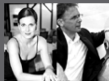
PINCSEK + SEYR SWING - JAZZ VORKOSTER - EINTRITT FREI