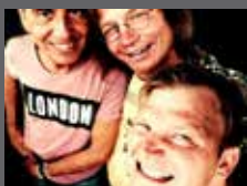
BENZER + BROLS BAND VINTAGE GARAGE ROCK LÖWENBAR - EINTRITT FREI