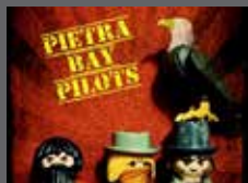
PIETRA BAY PILOTS FOLK - BLUES - AMERICANA ANTICO - EINTRITT FREI