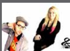
MADE IN ITALY MUSICA ITALIANA LA STRADA - EINTRITT FREI

ALLE INFOS UND ETWAIGE KURZFRISTIGE ÄNDERUNGEN AUF: WWW.LIVE-VEREIN.COM