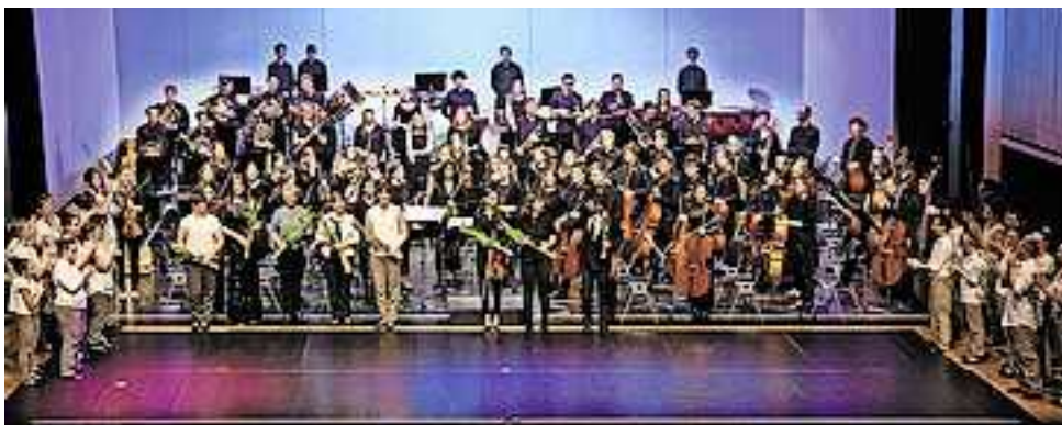
Grandios waren die Auftritte des Jugendsinfonieorchesters Mittleres Rheintal.

Das Publikum war berührt und gerührt, auch von den beeindruckenden Performances des Tanzhauses Hohenems, wo Menschen mit und ohne Behinderungen gemeinsam tanzen. Das Publikum bedankte sich mit „Standing Ovations“.