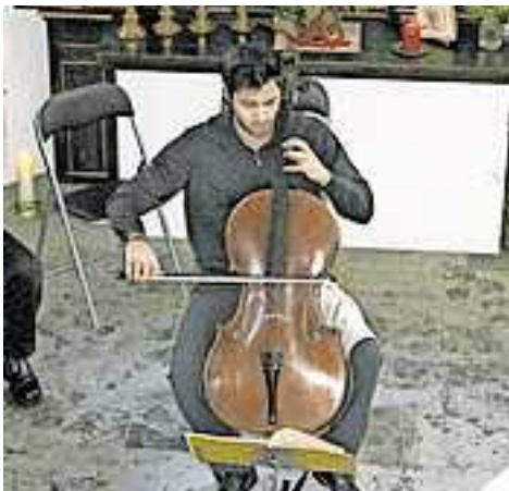
Kian Soltani begeisterte die Zuhörer