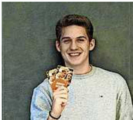
Weitere Infos unter www.aha.or.at/jugendschutz-und-kinderrechte

Dieser kann im aha abgeholt oder unter E-Mail aha@aha.or.at bestellt werden.