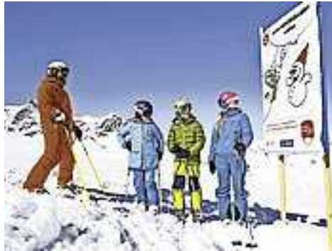
Weitere Infos unter www.sicheresvorarlberg.at

Der Folder „Sicheres Schifahren“ beinhaltet die Pistenregeln, die Beschreibung der wichtigsten Beschilderungen im Schigebiet und enthält