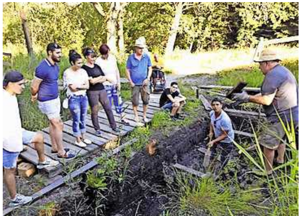
Im Sprachen-Café wird einiges geboten

sucht. Die Wanderung im Frühjahr zur Ruine Neuburg war ein toller Ausflug und das Kegeln machte allen Spaß. Im Sommer durften alle beim Brauchtumsverein „Scholla steacha“ und das Gemeindehaus wurde besichtigt. Auch ein Besuch beim Fischereiverein stand auf dem Programm. Die Sockenmanufaktur Bolter empfing ebenfalls alle sehr herzlich. Im Dezember war Kekse backen angesagt, was auch großen Anklang fand. Allen Vereinen und Firmen ein herzliches Dankeschön für die Gastfreundschaft.