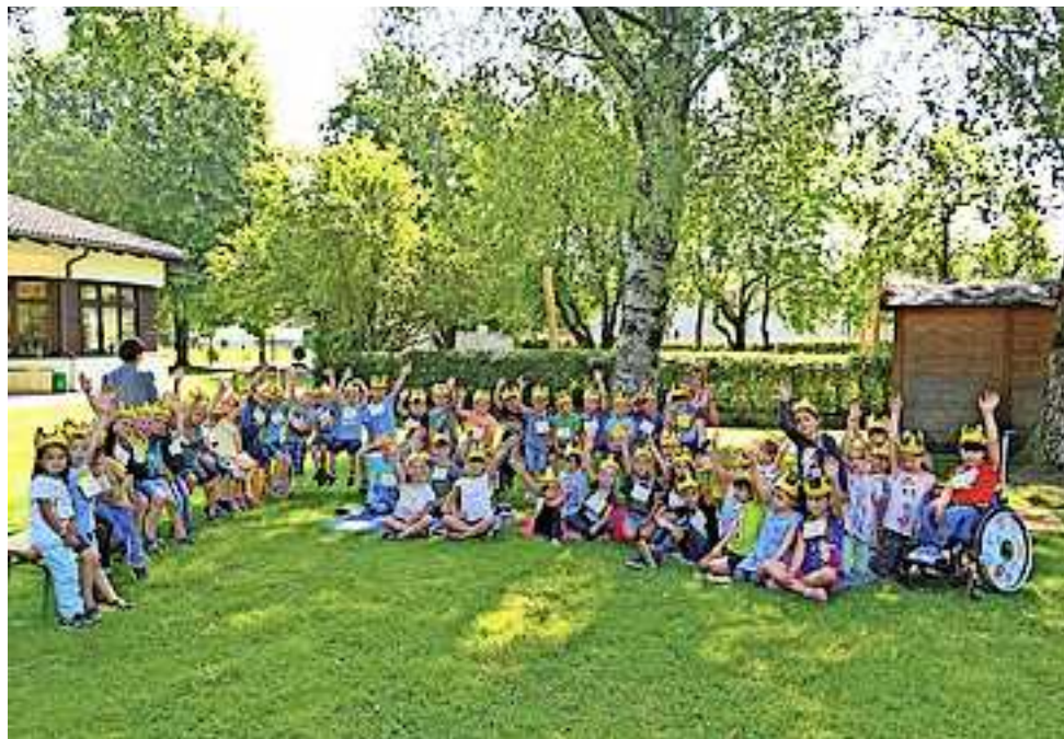
Die „Energiekönige“ vom Kindergarten Gmür

Im vergangenen Kindergartenjahr ging es um die Energienutzung und den umsichtigen Umgang damit. Gemeinsam wurde „ein Königreich für die Zukunft“ erschaffen. Die Ausstellung gewährt einen Einblick über die verschiedenen Erfahrungen, die die Kinder dadurch sammeln konnten. Zum Beispiel am stromfreien Tag, an dem die Kinder ohne elektronische Geräte auskommen mussten. Das Jahresprojekt stärkte das Umweltbewusstsein der Kinder und erweiterte ihr Wissen über erneuerbare Energien.