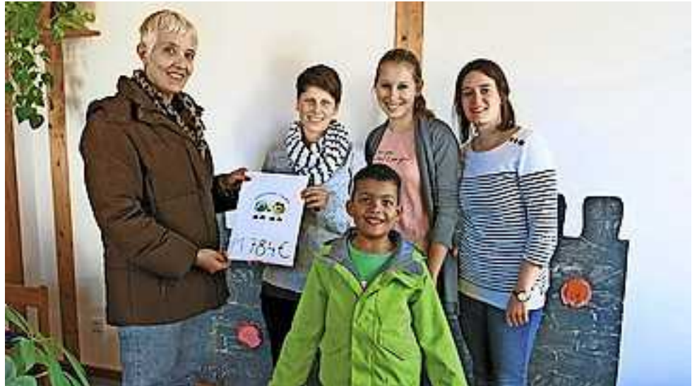
Spendenübergabe im Kindergarten Egatha

Sie möchten im Osten Nigerias ein Waisenhaus aufbauen, das Kindern ein Zuhause und eine Zukunft bietet. Durch die Mithilfe der Kindergartenkinder, die fleißig werkten, buken, klebten und malten, konnten viele verschiedene, selbstgemachte Waren zum Verkauf angeboten werden. Es gab ein kleines Singprogramm und für das leibliche Wohl wurde durch eine leckere Verpflegung gesorgt. Zum krönendem Abschluss gab es eine Weihnachtsbaumversteigerung.