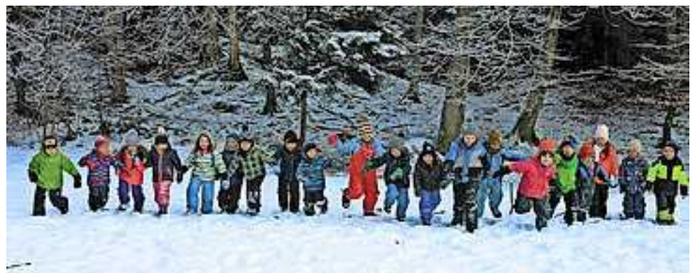
Die „Waldgruppe“ im Rheinmahd

Falls jemand Sachbeschädigungen beobachtet oder entdeckt, bitten wir dies im Kindergarten Egatha zu melden.