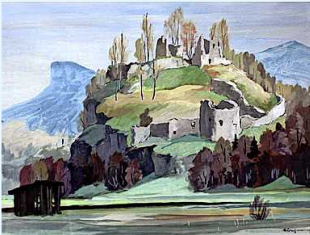
Burgruine Neuburg Koblach, Markus Bachmann 1963

Für die Restaurierung der westlichen Ringmauer haben Private und Firmen 2018 einen Betrag von € 4.490,00 gespendet. Herzlichen Dank dafür!