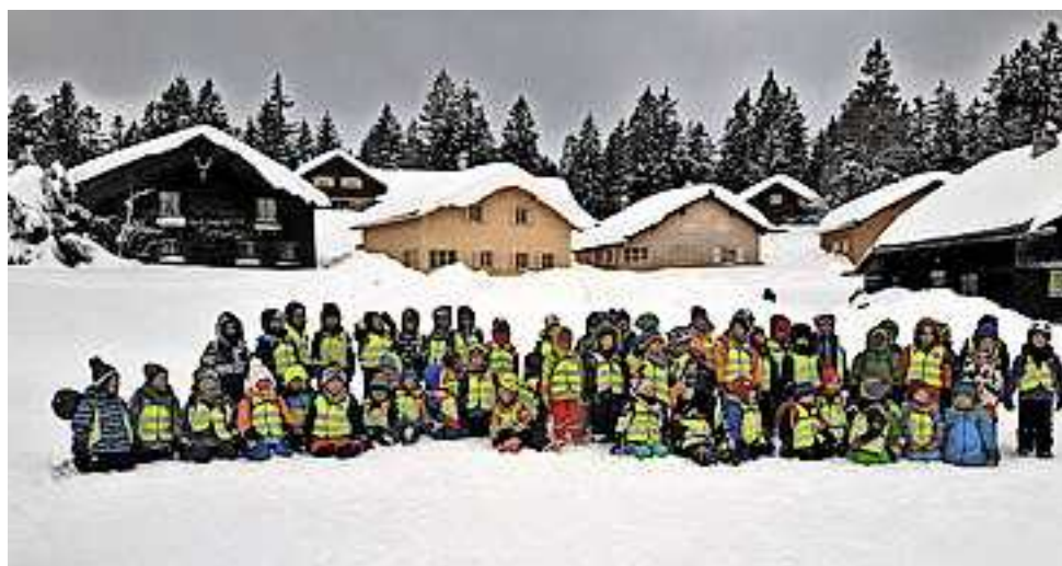
Die Kinder des Kindergartens Gmür

Die Kindergärtler hatten sehr viel Spaß und werden auch den restlichen Winter noch in vollen Zügen auskosten.