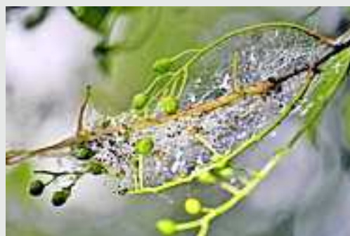
Gespinnst-Motte auf Traubenkirsche

Weitere Information bei Markus Perstling, Gemeinde Koblach, Tel. 05523 62875-2117 oder auf der Homepage: koblach.at/umwelt/mobilitaet/naturvielfalt/faszination...d'natur z'kobla