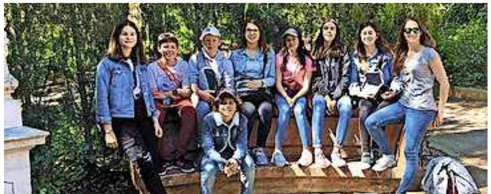
Mittelschüler in Barcelona

Strand „Playa de Barceloneta“. Auch die „Sagrada Familia“, „La Rambla“, am Hafen die Columbus Statue und das „Mare Magnun“ wurden besucht. In diesen Tagen konnten die Schüler ihr Können in der spanischen Sprache unter Beweis stellen und Spaß daran haben. Auch das Suchspiel „Finde den Ort auf dem Foto“ war für die Schüler kein Problem. Viele Kleinigkeiten der spanischen Kultur wie „Tapas“, „Ensamadas“ und Co wurden entdeckt und mit bereits gelernten Informationen verknüpft. In der großen Stadt Barcelona wurde auch die Selbstständigkeit und das Selbstbewusstsein gestärkt. Es war eine tolle Sprachreise in Spanien mit vielen neuen Entdeckungen und Abenteuern.