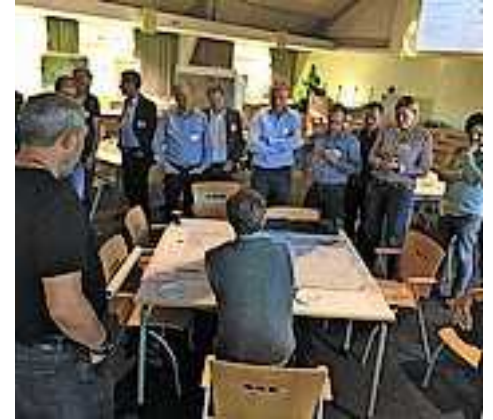
Der Fuß- und Radverkehr im Rheintal ist Schwerpunkt des Agglomerationsprogramms.

Die Preise für den Kauf von öV-Tickets auf Vorarlberger und St. Galler Seite klaffen weit auseinander. Diese Tatsache macht den grenzüberschreitenden öV unattraktiv. Eine Studie analysiert die Ist-Situation der Tarifstrukturen mit dem Ziel, umsetzbare Lösungsansätze zur Optimierung der Situation aufzuzeigen.