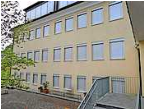
Neue Jalousien der Volksschule

Verschiedene Baumaßnahmen wurden in der VS Koblach bisher getätigt. Im Kellergeschoß wurden für eine Klasse und einen Werkraum neue Jalousien angeschafft. Es wurden aus Brandschutzgründen RWA Schalter für Rauchabzugsfenster montiert. In den Gängen beim Turnsaal wurden neue LED Leuchten angeschafft und alle Leuchtkörper in der Turnhalle ausgetauscht. Für den schon in die Jahre gekommenen Turnsaal sind in den Sommerferien weitere Verbesserungen (Austausch der Stoffwandelemente) angedacht.