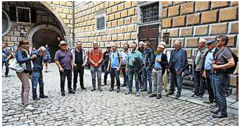
Der Männerchor in Ausflugsstimmung

Ein abschließender Höhepunkt war die Führung durch Stift Schlägl im Südböhmischer Wald mit herzhaftem Mittagessen im Stiftskeller, bevor die Männerchörer mit ihren Frauen am Sonntagabend wohlbehalten nach Koblach zurückkehrten.