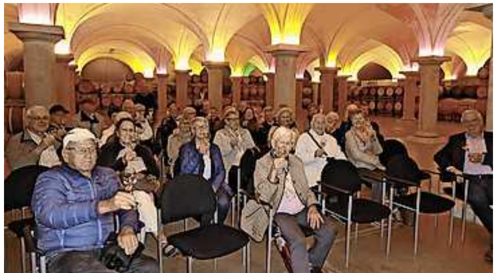
Verkostung im Kellergewölbe

Produkte und die wurden auf Anraten des Begleiters mit Vorsicht genossen. Im schönen Kellergewölbe, umgeben von Eichenfässern und mit toller Beleuchtung, gab es Hugo und Cidre zu verkosten. Abschließend durften im Geschäft noch verschiedene Essige, vermischt mit den dazu passenden Ölen, probiert werden.