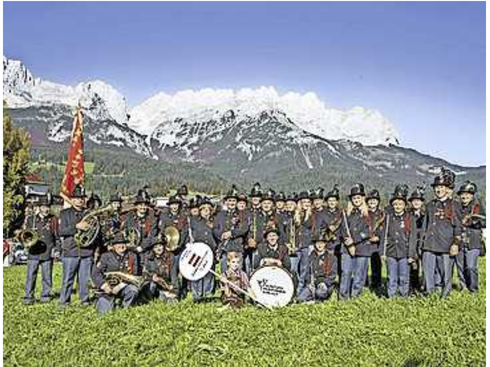
Frühschoppenkonzert mit dem Schützenmusikverein Koblach

Bewohner, Angehörige, Interessierte und Freunde sind sehr herzlich zu diesem Fest eingeladen. Das Team von zKobla dahoam und das Haus der Generationen freuen sich auf ein gemütliches und geselliges Beisammensein. Die Veranstaltung findet nur bei schönem Wetter statt.