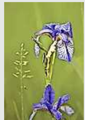
Sibirische Schwertlilie

Weitere Information bei Markus Perstling, Gemeinde Koblach, Tel. 05523 62875-2117 oder auf der Homepage: koblach.at/umwelt/mobilitaet/naturvielfalt/faszination...d'natur z'kobla