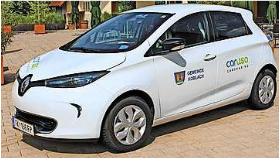
Carsharing, eine Alternative zum eigenen Fahrzeug

In Kooperation mit der Caruso Carsharing eGen steht umweltbewußten Koblachern das gemeindeeigene E-Auto ab Mitte Juni 2019 zur Verfügung. Vorerst kann das Auto an Wochenenden gebucht werden.