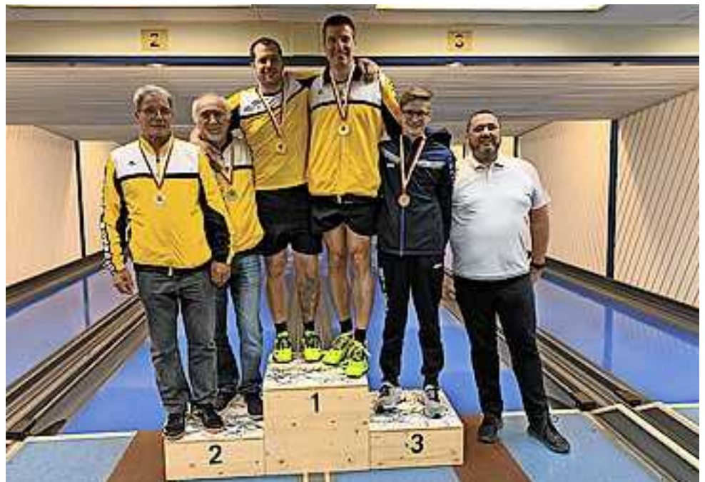
Die erfolgreichen Kegler