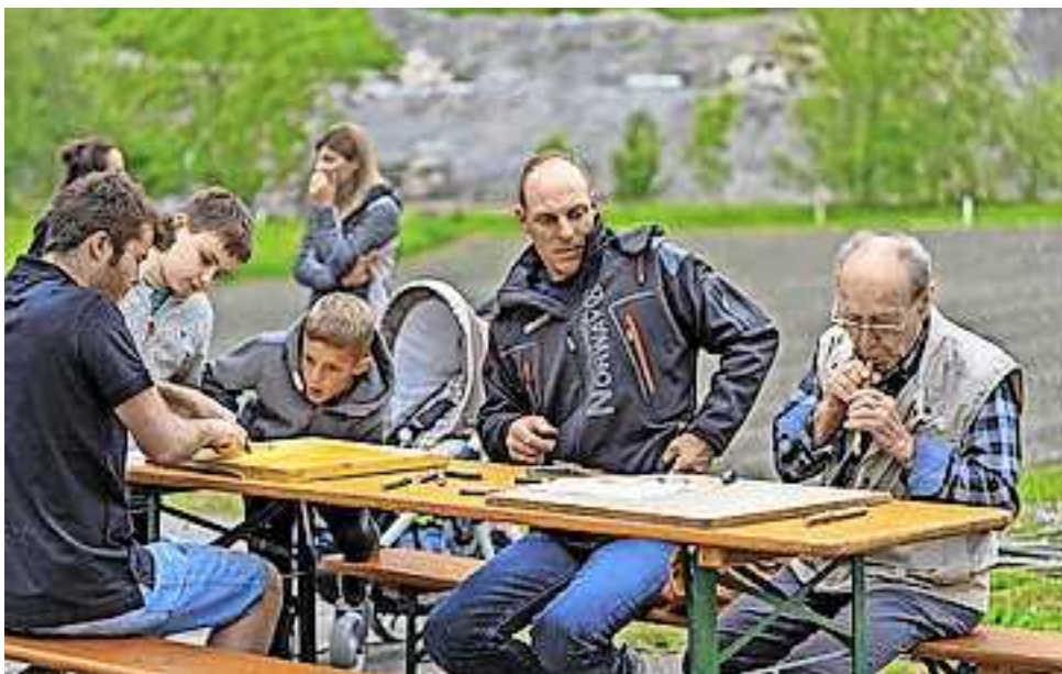
Es wurde eifrig geschnitzt