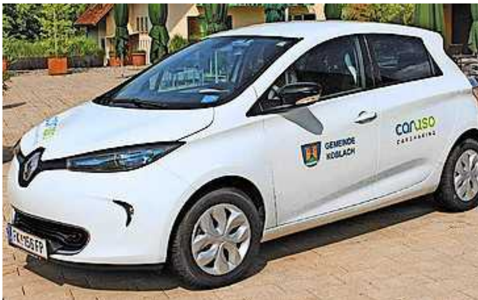
Carsharing, eine Alternative zum eigenen Fahrzeug

Während der Umweltwoche sind Sie eingeladen, sich über das Carsharing zu informieren und das Auto zu besichtigen. Vertreter von Caruso Carsharing und das Koblacher e5 Team werden Ihre Fragen beantworten.