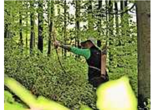
Ein tolles Wochenende für die Bogenschützen

Am Kummer wurde für die Bogenschützen eigens ein Parcours mit 28 dreidimensionalen Tieren aufgestellt, an denen sie sich zwei Tage lang messen durften. Dank des tollen Wetters kamen auch alle wieder trocken zurück. Für die Verpflegung wurde mit der Unterstützung vieler Helfer bestens gesorgt. Zum Schluss gab es dann für die besten Schützen ein Trinkhorn, verziert mit dem Vereinslogo. Alle Teilnehmer haben ein sehr gelungenes Event mit sehr positiven Rückmeldungen erlebt.