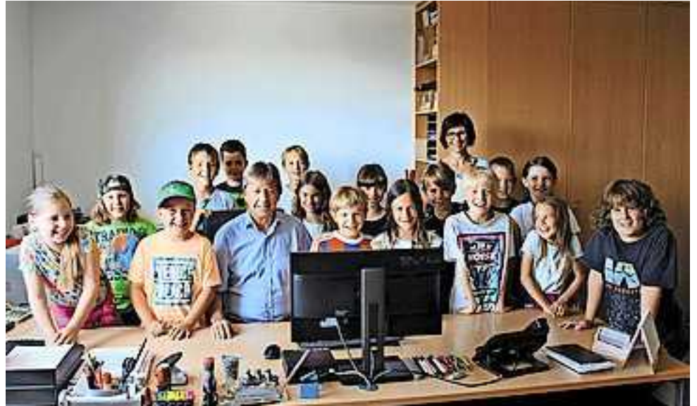
Die Volksschüler beim Bürgermeister

Der Bürgermeister freut sich, auch in den kommenden Wochen Volksschulklassen mit einem ähnlichen Programm durchs Gemeindeamt führen zu dürfen.