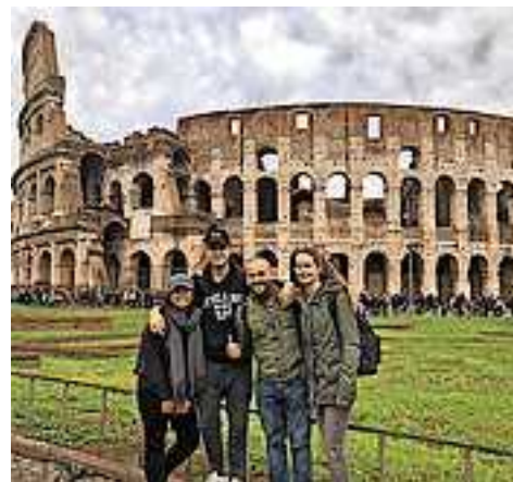
Weitere Informationen unter www.aha.or.at