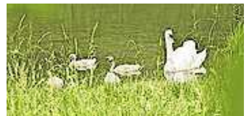
Schwanenfamilie am Alten Rhein