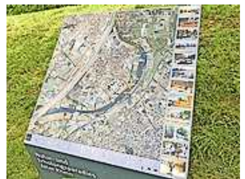
Die insgesamt fünf soliden und schönen Infostelen bieten dieselben einheitlichen und übersichtlichen Infos und Gebietsregeln wie die faltbare Gebietskarte und sind in allen beteiligten Gemeinden aufgestellt.