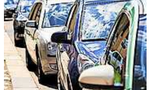
Was bei Hitze im Auto für Kinder gilt, gilt ebenso für Tiere.