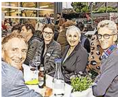
Ausgelassene Stimmung bei den Wirtschaftstreibenden.