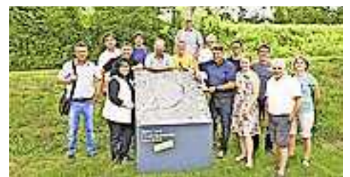
Gruppenbild an einer der neuen Infostelen am Ende der Fahrt beim Gutshof Heidensand in Lustenau