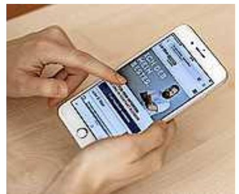
Alle Informationen zur Blutspende sowie Termine auf www.gibdeinbestes.at oder unter Tel. 0800/190190.

Blutspenden können alle gesunden Menschen ab 18 Jahren, die gewisse medizinische und gesetzliche Kriterien erfüllen. Zur Blutspende ist ein amtlicher Lichtbildausweis notwendig.