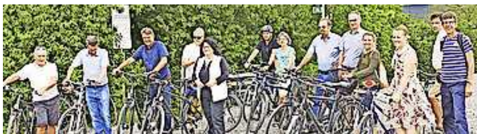
Das Projektteam samt politischer Vertreter bei der Abfahrt zur gemeinsamen Fahrraderkundungsfahrt in Mäder.

Am vergangenen Freitag, dem 14. Juni 2019, wurde gemeinsam das Gebiet per Fahrrad erkundet und einige schöne und spannende Örtlichkeiten am Alten Rhein besucht. Der Start erfolgte in Mäder und endete via Altach, Hohenems und Diepoldsau schließlich am Rohr in Lustenau, wo eines der neuen Info-Pulte vorgestellt wurde. Die Zusammenarbeit ist im Rahmen des Agglomerationsprogramms Rheintal entstanden und wurde vom Verein Agglomeration Rheintal unterstützt. Weitere Infos unter www.agglomeration-rheintal.org