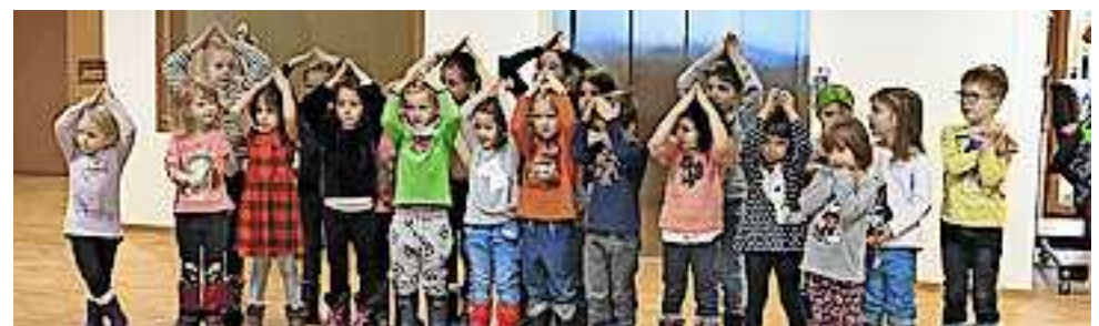
Das Singen macht allen viel Spaß

der Gesangsgruppe anschließen, sind willkommen. Das letzte Singen für dieses Kindergartenjahr fand Anfang Juni statt. Aufgrund der Ferien wird in den Sommermonaten pausiert. Das nächste Singen findet voraussichtlich im Oktober statt (Gemeindeblatteintrag beachten). Danke an alle Zuhörer, die in diesem Jahr dabei waren.