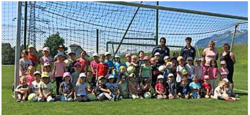
Die sportlichen Kindergärtler

Voller Freude wurde die Einladung angenommen. An diesem Vormittag konnten sich die Kinder unter anderem an einem Hindernisparcours mit und ohne Ball versuchen, ihre Fähigkeiten, Pässe zuzuspielen ausprobieren und ihre Ausdauer bei verschiedenen Fangspielen unter Beweis stellen. Der Höhepunkt war für die Kinder