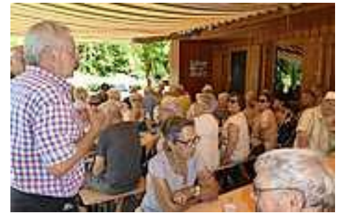
Geselliges Zusammensein der Seniorenbundmitglieder