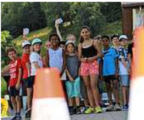
Verkehrserziehung in der Volksschule

„Hallo Auto!“ Die Drittklässler der Volksschule Koblach haben am Vormittag des 25. Juni mit ÖAMTC-Instruktorin Žana den Anhalteweg selbst „erlaufen“ und „erbrems.“