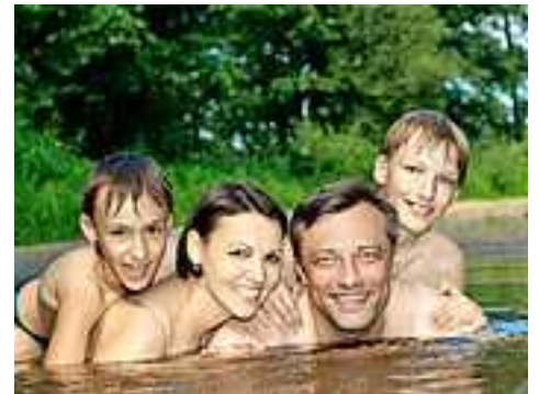
Gute Schwimmkenntnisse sind die beste Voraussetzung!

Ein wichtiger Punkt ist auch die Aufsichtspflicht: Kinder, auch wenn sie mit Schwimmhilfen ausgerüstet sind oder bereits erste Schwimmkenntnisse haben, dürfen nie aus den Augen gelassen werden!