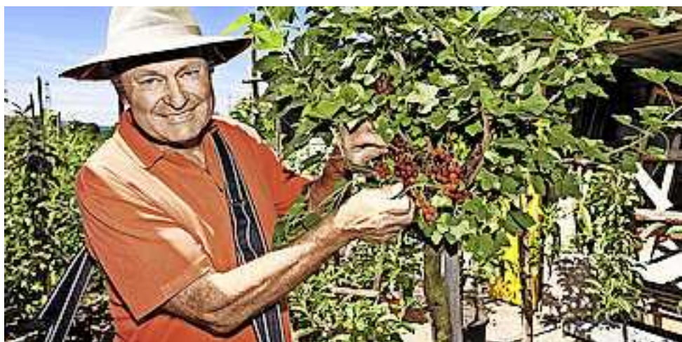
Alle Infos zur Obstbörse mit den entsprechenden Ansprechpartnern unter www.ogv.at .