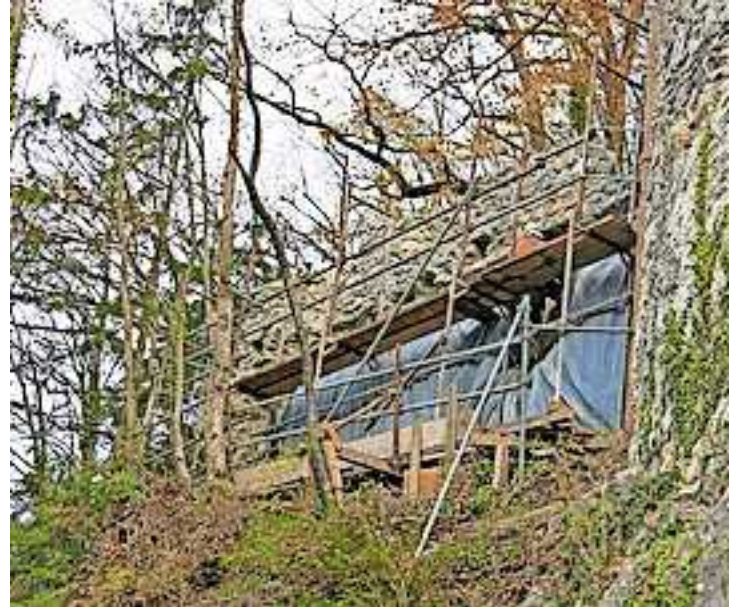
Restaurierungsarbeiten an Gefängnisturm und westlicher Ringmauer