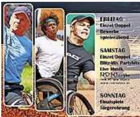
Die Staatsmeisterschaften im Rollstuhltennis versprechen Spannung pur.