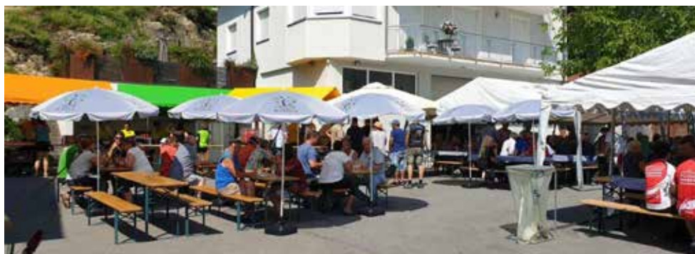
Stimmung und Bewirtung waren beim Mostfrühschoppen vom Allerbesten.