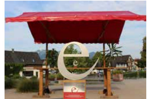
Das Koblacher e5- Team freut sich auf ein reges Interesse am Flohmarkt.

Unter anderem wird die Jugendfeuerwehr Koblach ihr Können demonstrieren. Die Bevölkerung ist zum Besuch des e5 Flohmarktes mit einem reichhaltigen Rahmenprogramm recht herzlich eingeladen.